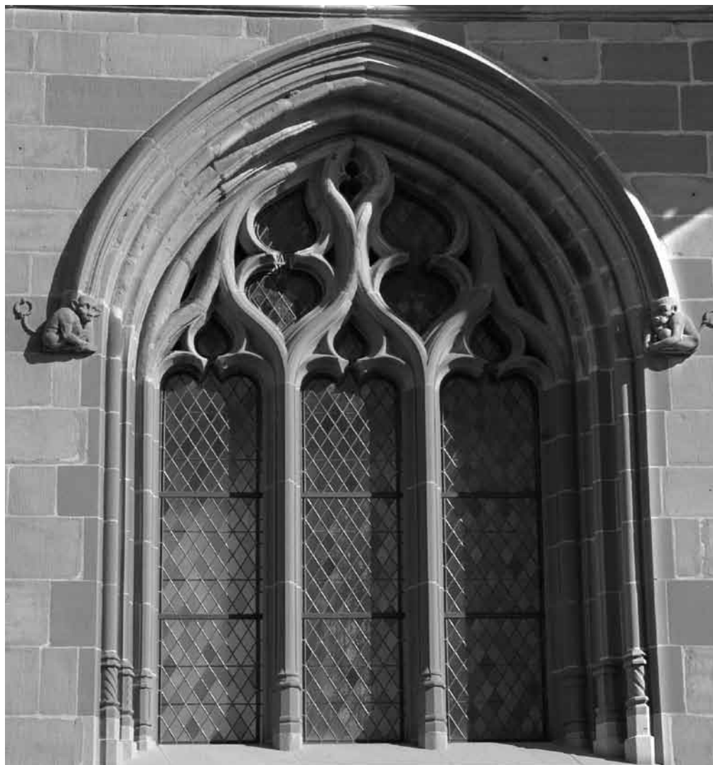
Singes enchaînés, grande fenêtre ouest de l'église, sculpté en 1569 par Uli Bodmer