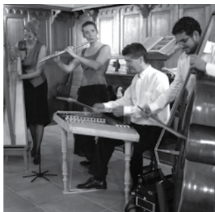
Musiciens du groupe Filigrane

Dimanche 15 novembre 17h à l'église de Chexbres