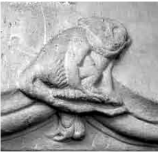
Le singe et son petit, situé au-dessus de la porte des pas-perdus cour orientale du château de Lutry, sculpté en 1573 par Jacques Bodmer.