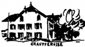
Ferme de Chaufferosse

Arrivés à la ferme contemporaine du Closy – « petit endroit fermé », du verbe latin claudere, « fermer », peu de participants se seraient doutés qu'en 1904, un autre révolutionnaire avait passé quelque temps dans l'imposante ferme d'alors, démolie à la fin du XXe siècle: il s'agissait de Lénine, ce qui valut à l'ancienne ferme, aujourd'hui disparue, d'être un pèlerinage particulièrement connu des communistes, jusqu'à la chute du Mur de Berlin.