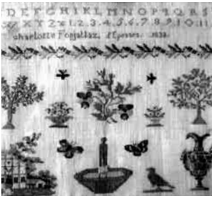
Abécédaire brodé par Charlotte Fonjallaz en 1832.