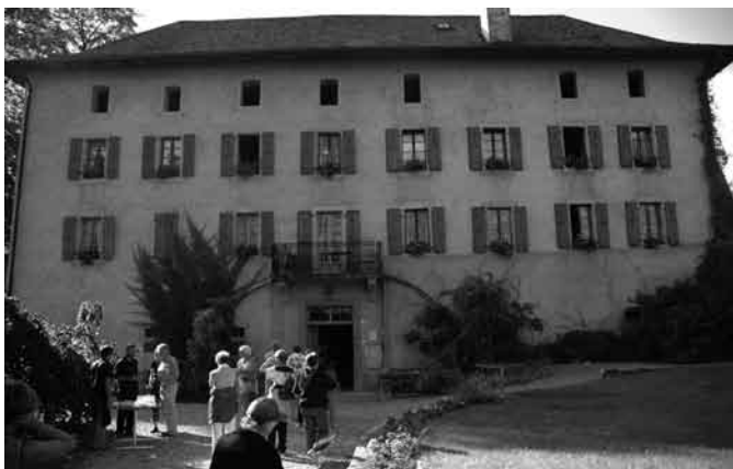
Abbaye de Salaz, sur la commune d'Ollon et ancienne propriété de l'abbaye de St-Maurice.